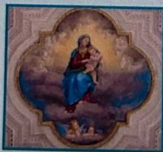
Particolare della volta affrescata

La prima festa fu celebrata il 6 maggio 1686 e viene ripetuta ogni anno la prima o la seconda domenica di maggio.